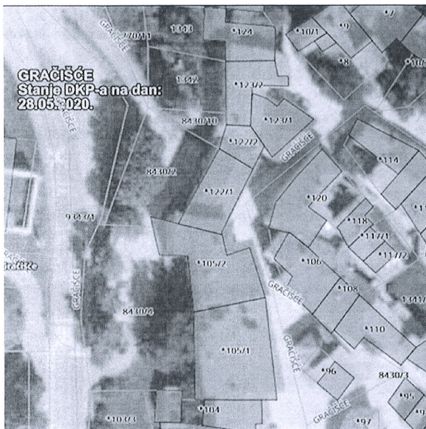
Slika iz elaborata